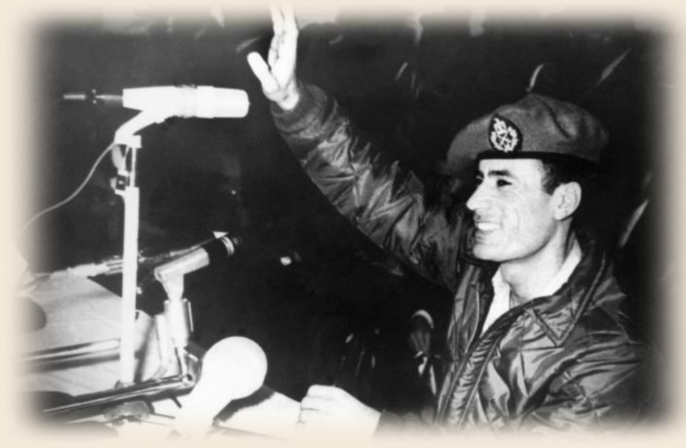
Le 14 novembre 1969, Mouammar Kadhafi salue la foule pour la première fois depuis le renversement de la monarchie libyenne.

Cet article fait partie d'une longue série d'histoires tragiques impliquant l'impérialisme américain et la désinformation des médias. Comme pour toutes les autres, vous devez mettre de côté toutes les bêtises que vous avez lues dans les médias occidentaux sur la Libye et son président, Mouammar Khadafi , et découvrir certaines vérités.