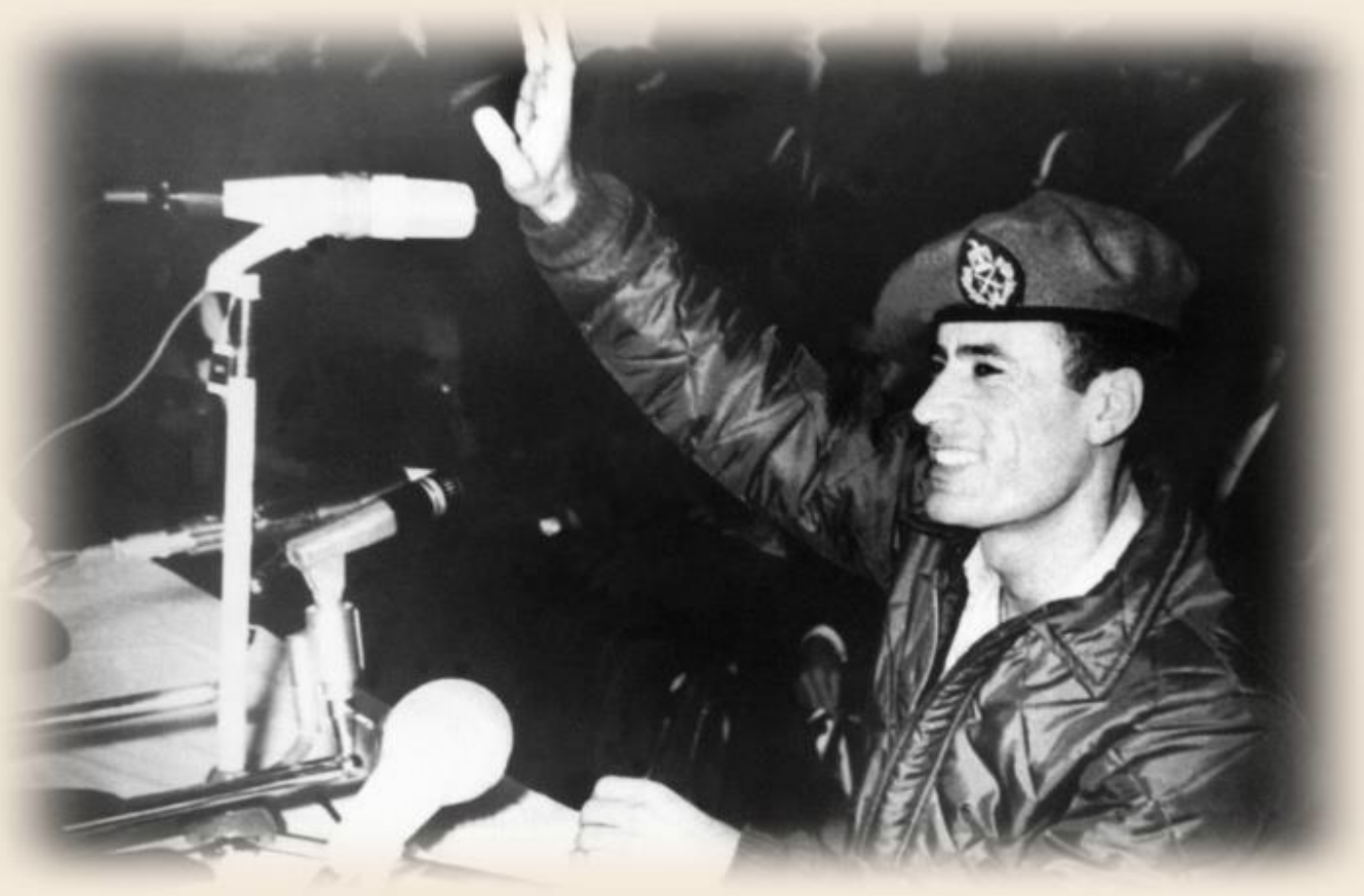
Il 14 novembre 1969, Muammar Gheddafi saluta la folla per la prima volta dopo il rovesciamento della monarchia libica.

Gheddafi divenne leader della Libia con un colpo di stato incruento contro il vecchio re Idris [1], che era stato insediato dalle potenze imperiali dopo l'ultima guerra e che era stato più che disposto a cedere tutte le risorse petrolifere della Libia alle multinazionali occidentali in cambio del suo "regno". L'Occidente non ha mai perdonato Gheddafi per questo , e lo ha costantemente demonizzato nei media, ha imposto molti tipi di sanzioni contro il Paese e, in generale, ha fatto del suo meglio per punirlo per decenni per la perdita del suo Re Burattino. I media americani vi diranno il contrario, ma questa è la causa principale dell'ostilità occidentale nei confronti di Gheddafi e della Libia.