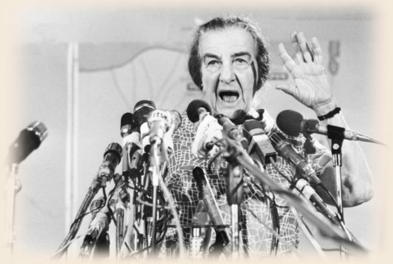
Golda Meir

Dar povestea tragică a Libiei a început cu adevărat în anii 1990, când președintele american Ronald Reagan a organizat o campanie aeriană masivă împreună cu Marea Britanie, cu scopul aproximativ de a "da o lecție Libiei". Faptele care au condus la acel asalt aerian nu au primit niciodată atenție în Occident; am fost în schimb hrăniți cu o versiune total fabricată, care era în interesul SUA și Israelului să o promoveze.