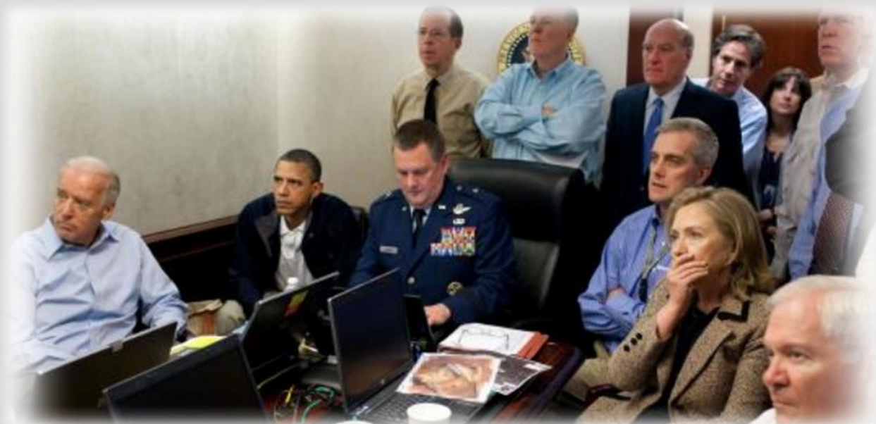
Nella sala di crisi durante l'assalto di domenica pomeriggio.

Una delle bugie più comiche, anche se imperdonabili, di questa narrazione era stata la foto, ampiamente pubblicizzata del Presidente Obama, di Hillary Clinton e una dozzina circa di membri dello staff della Casa Bianca e dell'esercito riuniti davanti a quello che sembrava essere uno schermo televisivo, tutti a guardare in diretta "tramite uno speciale collegamento satellitare" l'assalto della squadra SEAL alla casa di Bin Laden. Quando gli esperti avevano rapidamente definito questo fatto come una ridicola impossibilità, la Casa Bianca non ne aveva più parlato ma la foto falsa esiste ed esisterà per sempre. Inizialmente, la Casa Bianca aveva affermato di avere il video ripreso in diretta ma che aveva scelto di non rilasciarlo; in seguito, di fronte alla storia traballante di Obama, la Casa Bianca aveva dovuto ammettere che non c'era alcun video e che l'intera sessione fotografica della Casa Bianca nella "Bin Laden Situation Room" era effettivamente un falso. Né Obama né la Clinton si sono mai scusati per questa sorprendente bugia.