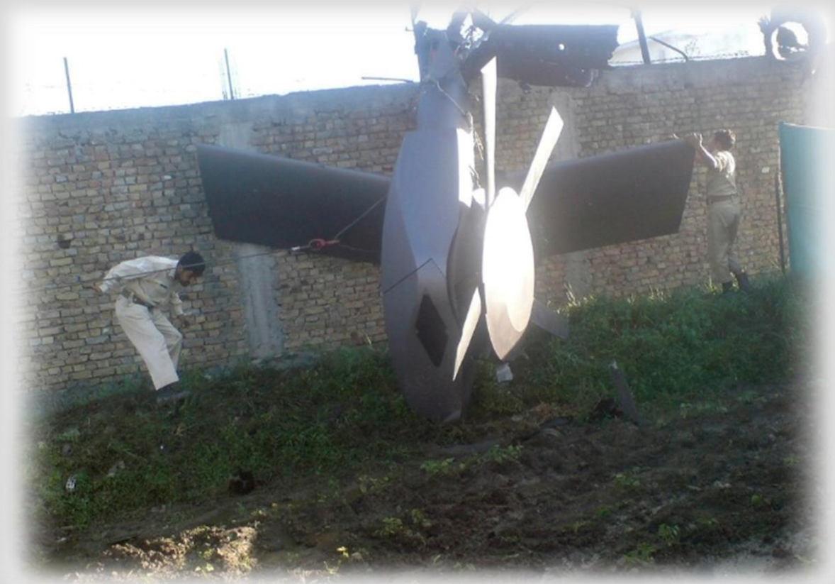
Foto del NYT dell'elicottero che si dice sia stato distrutto, uccidendo il Seal Team 6. Fonte

Ma le contestazioni alla storia non si placavano e gli americani continuavano ad inventare nuovi dettagli nella loro disperazione di tappare i buchi. Nel luglio 2013 eravamo venuti a conoscenza di un "rapporto speciale top secret" – attribuito alle autorità pakistane ma, in realtà, redatto dalla CIA e che era stato "ottenuto e divulgato" da Al-Jazeera , il nuovo portavoce del governo statunitense in Medio Oriente [4] [5]. Il rapporto faceva un disperato tentativo di dare credibilità alla sempre più vacillante narrazione ufficiale statunitense riportando un'ammissione ufficiale (anche se segreta) da parte pakistana dei "fatti" (inventati). In particolare, il rapporto faceva notare che le Forze di Difesa pakistane non erano riuscite a rilevare i sei elicotteri americani che erano entrati e rimasti per ore nello spazio aereo pakistano e che i primi jet da combattimento pakistani erano stati fatti decollare 30 minuti dopo che gli americani erano già usciti dal Pakistan con il corpo di Bin Laden – in altre parole, più di tre ore dopo la fine dell'operazione. "La portata dell'incompetenza [pakistana], per usare un eufemismo, era stata sbalorditiva, se non addirittura incredibile", si leggeva nel rapporto, che pretendeva di rappresentare l'ammissione pakistana della propria stupidità, anche si trattava solo di un'ulteriore assurdità, perché nessun pakistano avrebbe espresso quei sentimenti in quel modo. L'espressione stessa e le parole usate erano americane al 100%.