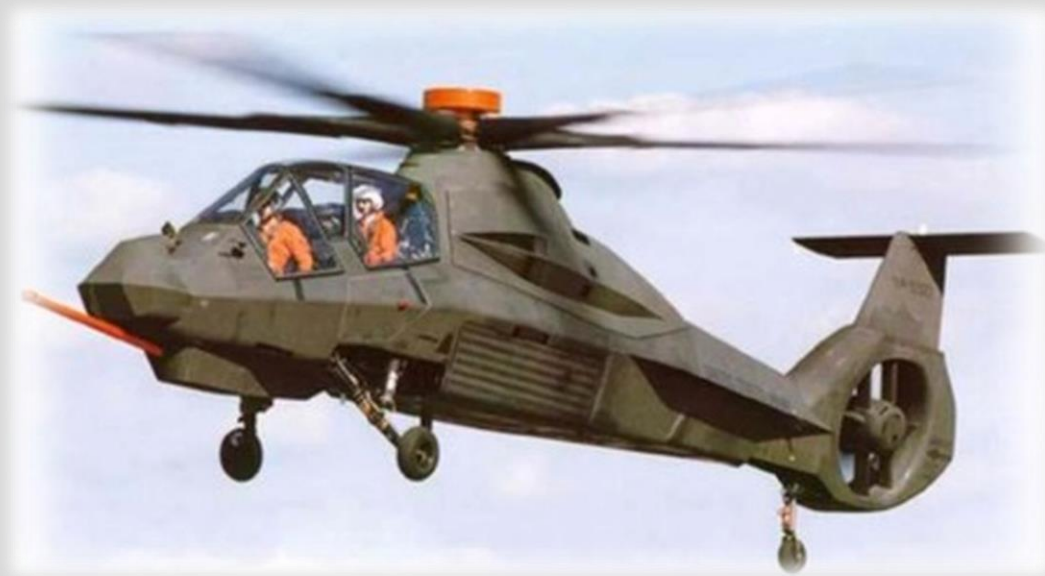
Il RAH-66 Comanche disponeva di alcune tecnologie stealth.

Poi c'era stato lo strano problema dell'elicottero distrutto che, a quanto pare, si era schiantato durante l'atterraggio (un "momento al cardiopalma", secondo Hillary) e che i commando avevano distrutto con l'esplosivo prima di partire e con il corpo di Bin Laden pronto per lo shampoo. A rischio di apparire pignoli, le foto pubblicate dei SEAL dell'elicottero distrutto avevano sollevato alcune domande. La maggior parte degli esplosivi che conosco tende a fare a pezzi le cose e a spargere i pezzi in giro, ma, a quanto pare, questi SEAL avevano un nuovo esplosivo "stealth", che distrugge completamente un velivolo e poi raccoglie tutti i pezzi rimasti in un mucchietto ordinato, che il netturbino porterà via il mattino dopo. Inoltre, questo nuovo esplosivo "stealth" deve essere molto silenzioso e far esplodere tutto semplicemente con un sussurro, visto che nessuno nelle basi militari vicine aveva sentito nulla. Ma la cosa non sorprende, visto che non avevano sentito alcune migliaia di colpi di arma da fuoco.