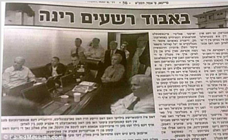
Photoshoppata: Il quotidiano chassidico aveva pubblicato una versione alterata della foto della Situation Room, eliminando le donne.

Si tratta solo di una piccola curiosità ma, nella foto qui sopra, notate Audrey Tomason, la giovane donna in alto a destra, che fa capolino tra i due uomini. Quando questa foto era stata diffusa in Israele, sia Hillary Clinton che la giovane donna erano state cancellate dall'immagine, come si può vedere qui sotto. Secondo alcuni, i giornali ebrei ultraortodossi non pubblicano foto di donne perché pensano che possano essere una distrazione sessuale, ma non sono sicuro che questo valga per Hillary Clinton.